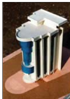
Maquette réalisée par les services techniques de la mairie

Le procès-verbal de réception des travaux a été signé en novembre 2001, alors que la plupart des services avaient déjà emménagé dans les bureaux de la mairie centrale. L'inauguration de la mairie a eu lieu du 4 au 7 décembre 2001, en présence d'une délégation d'élus du 93 et des membres d'A&D participant au projet.