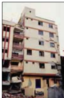
Représentatif de l'état général de la ville de Bekirpasa: un immeuble qui nécessitera d'importants travaux.

La démarche d'intervenir auprès d'une collectivité locale était fondamentale pour la Mission pour la Coopération décentralisée et la Paix :