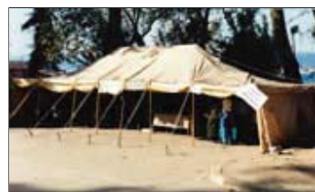
Mairie provisoire de Bekirpasa

De plus, elle possède les caractéristiques suivantes :