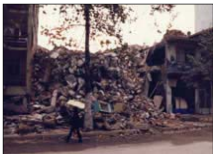
Izmit, bâtiment écroulé suite au tremblement de terre.