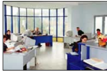
Les nouveaux bureaux de la mairie