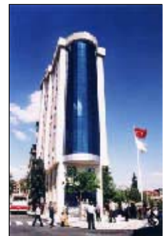
La mairie, le jour de l'inauguration