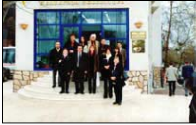
Les acteurs du projet