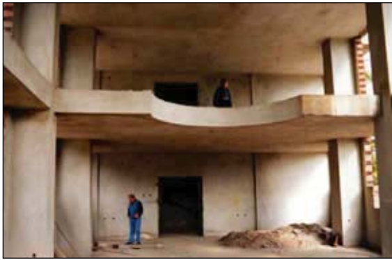
Photo prise lors du chantier de réhabilitation

Il y a un autre but aux missions exploratoires, d'essence relationnelle et humaine, qui est de valider le montage avec les partenaires et d'innover dans les montages opérationnels.