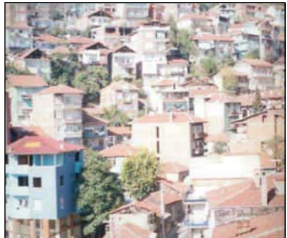
Izmit vue des toits

Le projet étant terminé, il est désormais possible de revenir sur son déroulement et son contenu afin d'en extraire les éléments constitutifs pour en tirer des enseignements pour l'avenir.