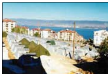
Habitations hébergées dans des tentes